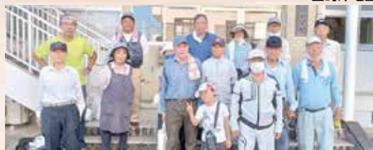
左底・久留里・日並・子々川地区