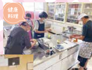
わくわく健康料理