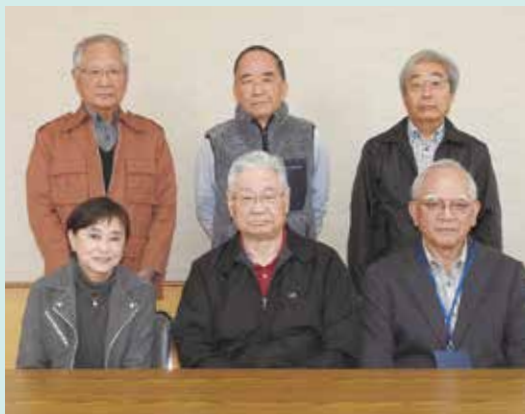
広報誌編集メンバー