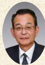
長与・時津 シルバー人材センター 理事長