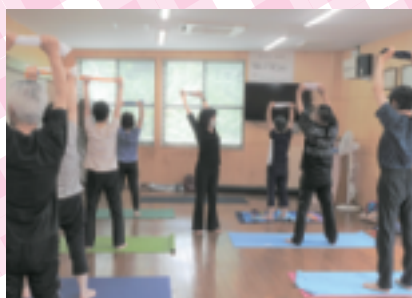
やさしいヨガ教室

今年度は、3講習が再開され、全4講習が開催されています。久しぶりの講習もあり、楽しまれているようです。