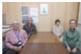
広報誌編集部会員

今年の長崎くんちは干支にふさわしい「龍踊」が秋空の下で奉納されることでしょうか。シルバー会員手作りの『にしそぎ』も新しいメンバー4人でスタートしました。取材を通し、会員の元気な姿に力をもらっています。一人でも多くの方に読んでいただくことを願っています。