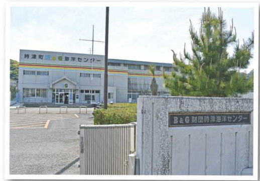
時津町B&G海洋センター