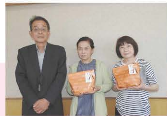
女性の会 名称表彰式

検討した結果、会員公募により、名称「女性の会 さくら咲楽」に決定。令和4年9月に設立されます。